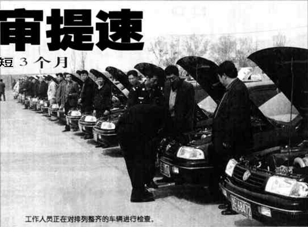
工作人员正在对排列整齐的车辆进行检查。

本报讯 市车辆管理所今年的机动车检审工作中,针对一些机关、厂矿、企事业单位车辆拥有量较多的单位,他们发动“机载检测车”实行上门服务,对比进行了大提速。今年我市的机动车检审工作自3月1日至7月30日结束,驾驶员审验工作自3月1日至6月30日结束,相对于往年10月底才能完成年审的情况,今年的年审在车辆、驾驶员大幅增加的前提下,比往年将缩短3个月完成。