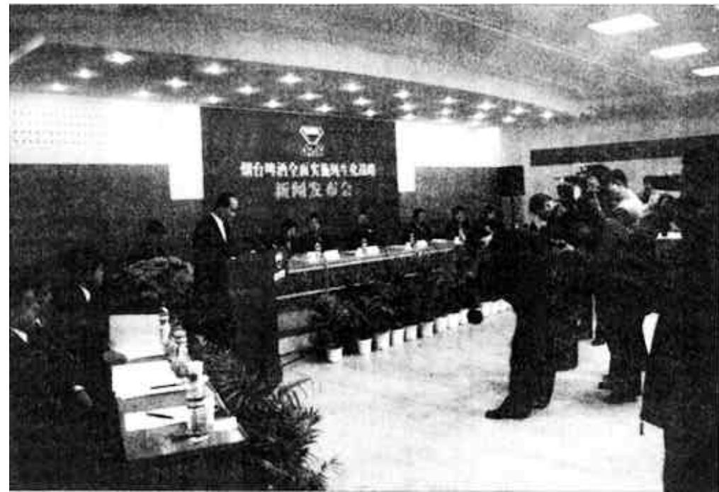
图为烟台啤酒全面实施纯生化战略新闻发布会现场。

——从世界上来看，纯生是潮流，纯生化的工艺是一种先进的和普遍的标准。在中国，纯生大众化是最终趋势；——实施纯生化管理符合更干净、更纯正、更营养、更健康的消费诉求，利于企业在新世纪应对加入WTO的挑战；——实施纯生化管理利于企业打造核心竞争力，全面主动摆脱低层次价格战，以产品品质推动企业发展；