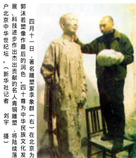
四月十一日，著名雕塑家李象群(右)在北京为郭沫若塑像作最后的润色。四十尊为中华民族文化发展、科技进步作出杰出贡献的名人青铜雕塑，将陆续落户北京中华世纪坛。