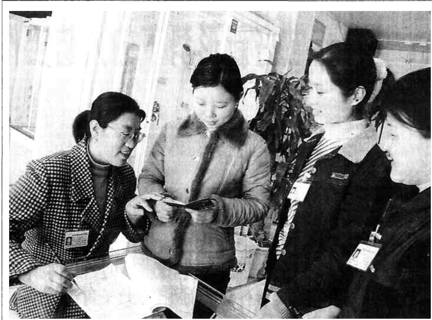
东营区文汇办事处商东社区居委会加强对流动人口的动态管理。近日,他们挨门挨户对整个辖区商户进行了清理检查,登记上表,清查中,认真查验婚育证明,签定计生合同,发放计生宣传材料,经统计流动人口已婚育妇女232人,未婚53人,全部纳入该居管理。