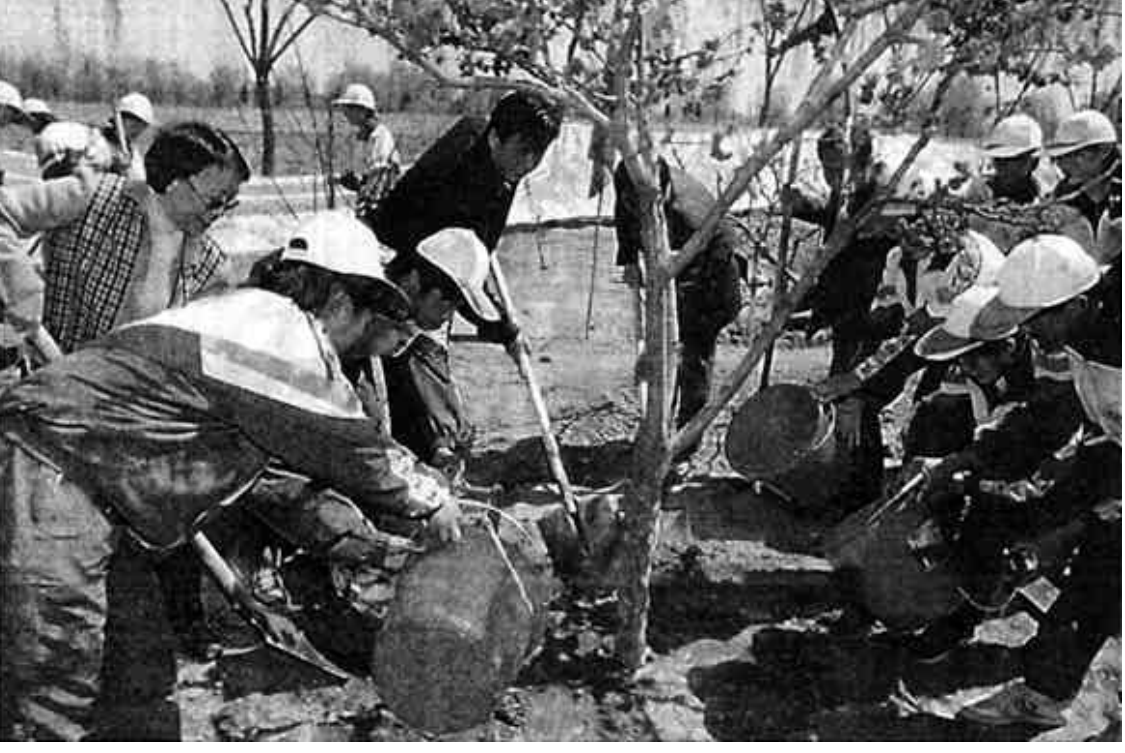
4月12日,由宋庆龄基金会、全国少工委等机构主办的2002年“太阳花杯”劝阻青少年吸烟系列活动正式启动。据统计,目前中国有3.2亿人吸烟,其中包括未成年吸烟者500万人。这是参加活动的北京中学生在“太阳花园林”植树,以实际行动倡议全国青少年远离一切不良嗜好。

据新华社北京4月13日电(记者曲志红)2001年度“全国十大考古新发现评选”揭晓,山西吉县柿子滩旧石器时代遗址等10项重大考古成果当选本年度十大新发现。同时入选的还有浙江萧山跨湖桥新石器时代遗址、青海民和喇家齐家文化遗址、深圳屋脊岭商代遗址、四川成都金沙商周遗址、贵州赫章可乐遗址、浙江杭州湾跨湖桥遗址、河南禹州神垕钧窑遗址、浙江杭州老虎洞南宋窑址和浙江杭州南宋恭仁里皇后宅遗址。据介绍,山西吉县柿子滩遗址群是中国目前距今2万—1万年间现存面积最大、堆积最厚、内涵最丰富的一处原地埋藏遗址。而出土的一大批陶、石、骨、木器的浙江萧山跨湖桥新石器时代遗址,被专家认为是—一个新时代的考古学文化类型,显示出浙江及我国东南地区传统的河姆渡文化与马家浜—良渚文化之外的“第三力量”。