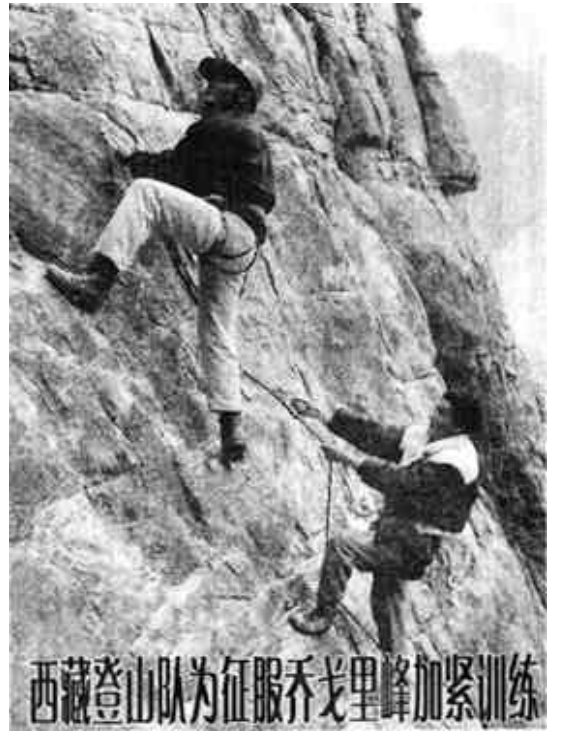
西藏登山队为征服乔戈里峰加紧训练

均国内生产总值在600美元以下;实际生活质量指数(预期寿命、人均摄取热量、入学率、识字率等)不超过47点;经济多种经营指数(制造业、工业就业比重等)不超过22点。目前全球经联合国批准的最不发达国家有49个,它们是:亚洲9国:阿富汗、孟加拉国、不丹、柬埔寨、老挝、马尔代夫、缅甸、尼泊尔、也门;非洲34国:安哥拉、贝宁、布基纳法索、布隆迪、佛得角、中非、乍