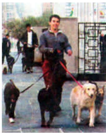
在美国纽约联合国总部大厦前，两名男子牵着一群宠物狗遛街。一些纽约人因工作繁忙，无暇照顾宠物，于是衍生出遛狗专业户。